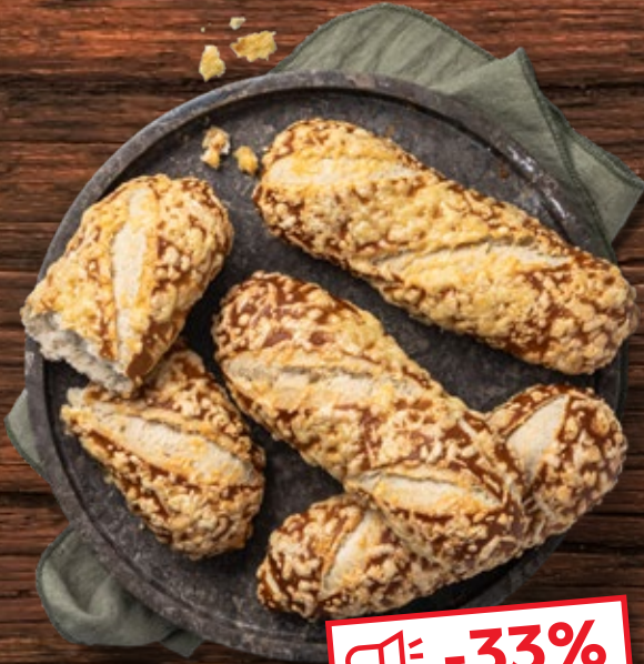
Laugenstange mit Käse überbacken je Stück