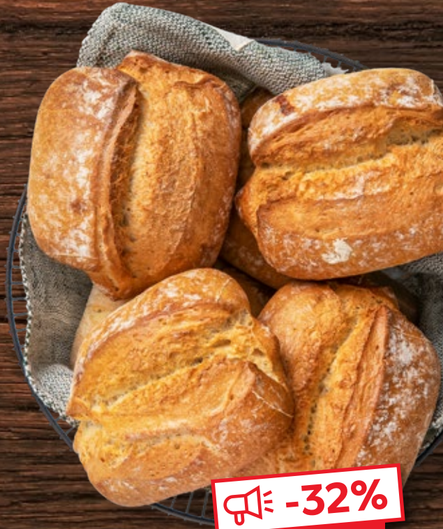
Bauernbrötchen mit knuspriger Kruste und saftiger Krume, mit Mehl aus dtsh. Anbau und Natursauerteig je Stück